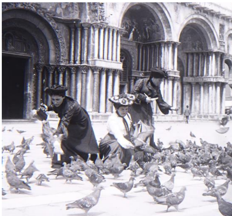
1903 Viaggio in Italia - Italia bajo la mirada de Ramón y Cajal 1903 Viaggio in Italia-Italia Ramón y Cajalen begiradapean